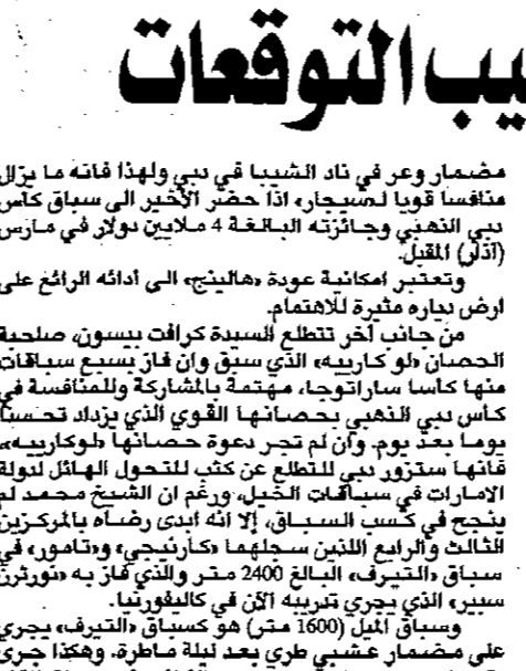
لندن - من توني ستافورد